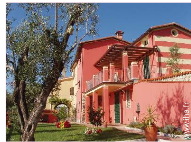
Appartement de Charme