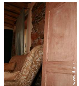
Appartement de Charme