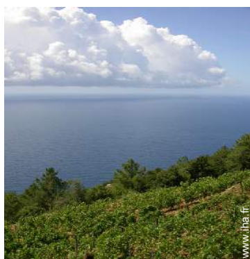
vue sur vignobles