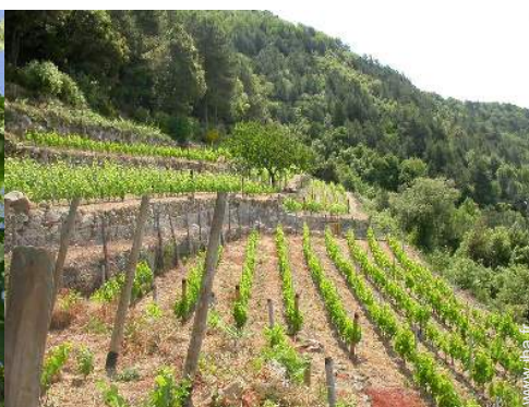
vue sur vignobles