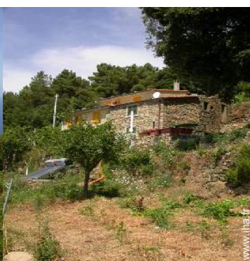
vue sur vignobles