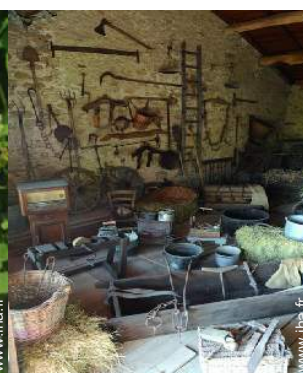
antiquité &#38; brocante