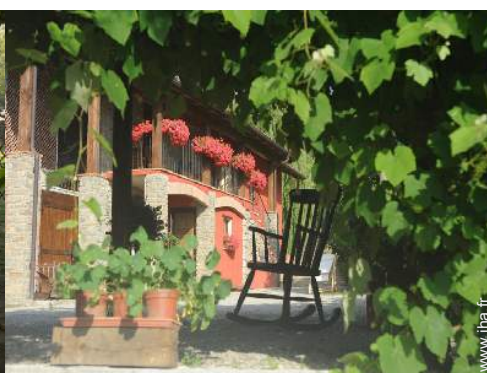
vue sur cour