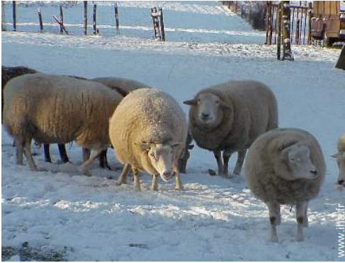
animaux de ferme