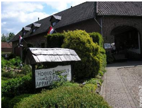
Maison de Campagne de Charme