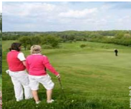
parcours de golf 18 trous