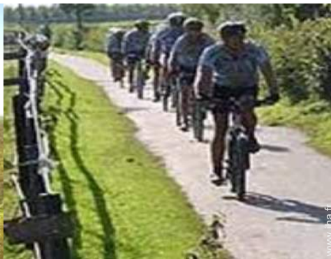
Attraits et détente