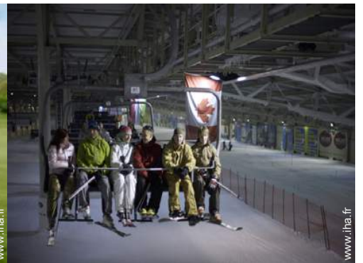
pistes de ski