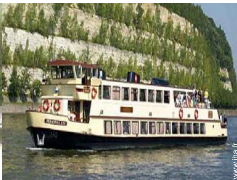
excursion en bateau