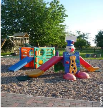
Equipements de loisir