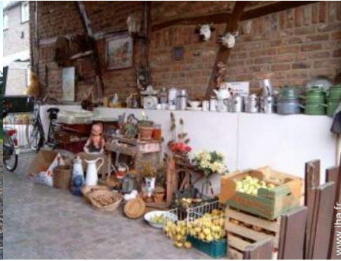
Fermette de Charme