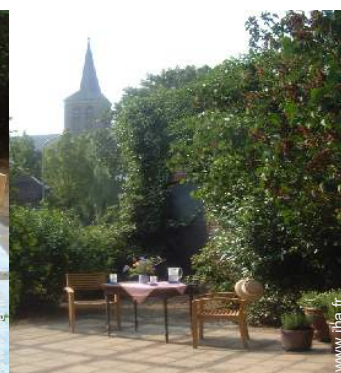
vue sur monument