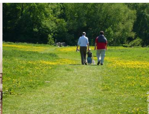
aménagement de loisirs