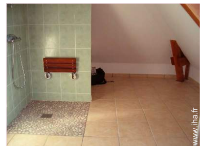
Maisonnette de Charme