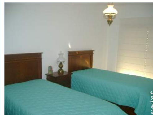
lit tiroir 1 pers

- Location de voiture - Location de bateau 100m - Location de matériel de plongée <50m - Location linge blanchisserie 100m - Boulangerie 100m - Traiteur <50m - Petits commerces 100m - Super marché 200m - Salon de coiffure 200m - Poste 200m - Banque 200m - Distributeur automatique de billets 200m - Pharmacie 200m - Médecin 200m - Infirmière 200m - Hôpital 25km - Dispensaire 200m