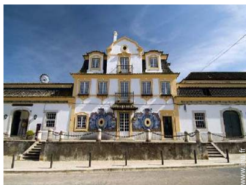
cave et dégustation de vin