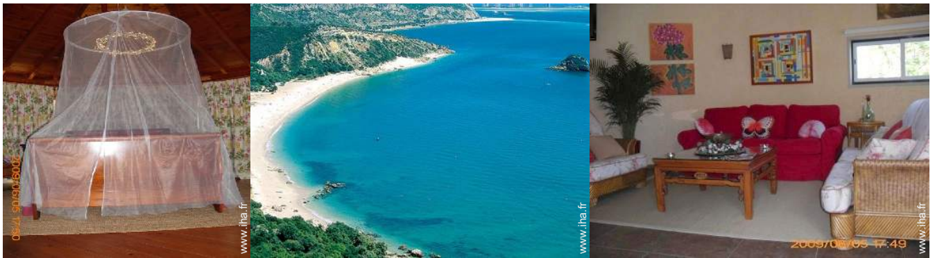
lit(s) double(s) à baldaquin