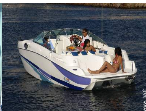
bateau à moteur