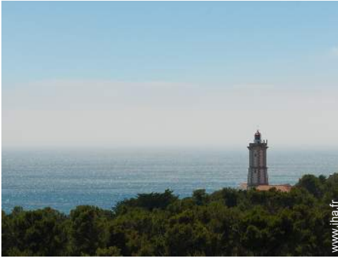
vue depuis la véranda