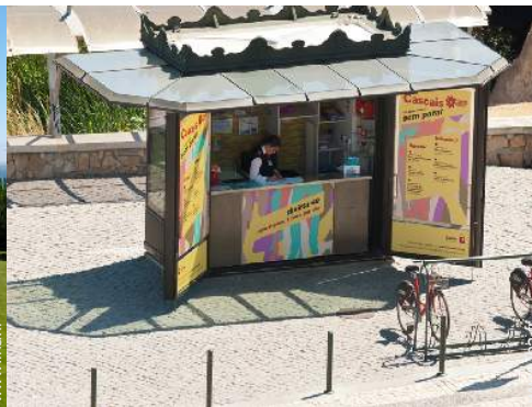
location de vélo/VTT