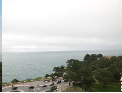
vue depuis la véranda