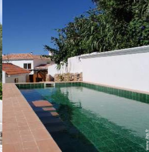
Equipements extérieurs à disposition des hôtes