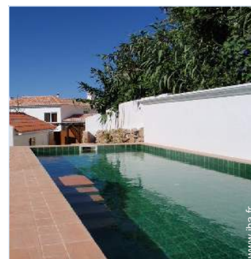
Equipements extérieurs à disposition des hôtes