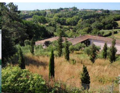
Equipements extérieurs à disposition des hôtes