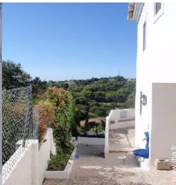
vue depuis le patio