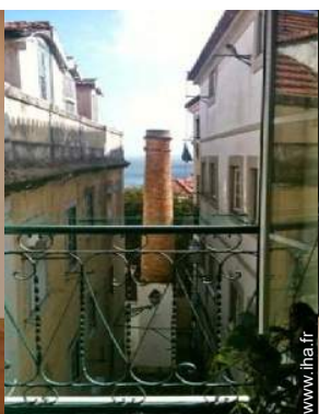
vue sur rivière