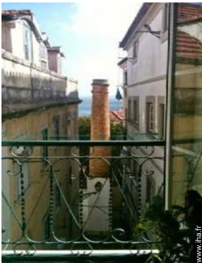
vue sur rivière