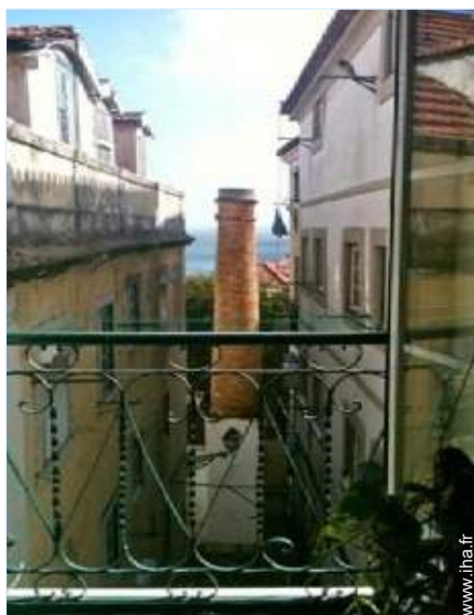
vue sur rivière