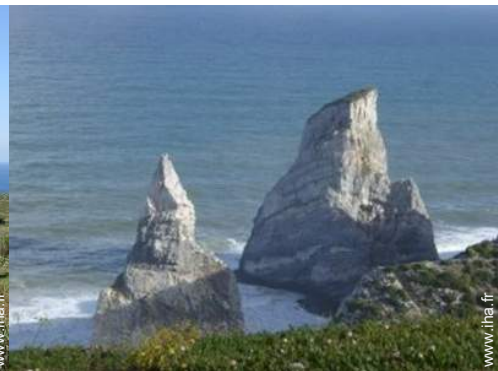
plage de naturisme