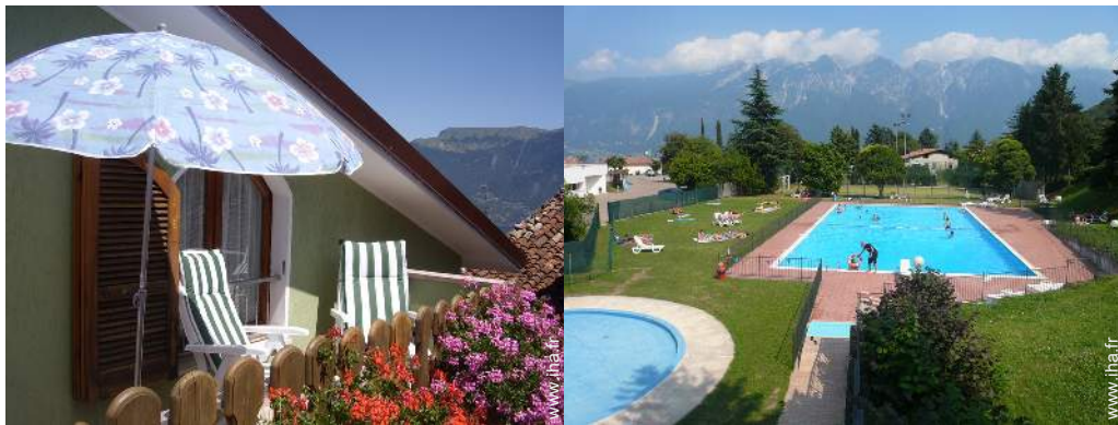
terrasse sur toit