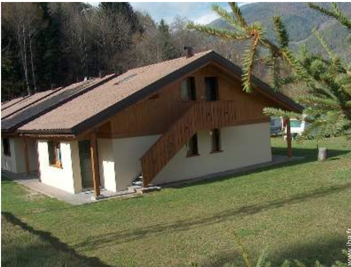
Chalet de Montagne