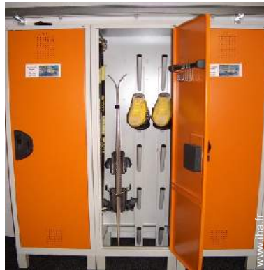
local à ski