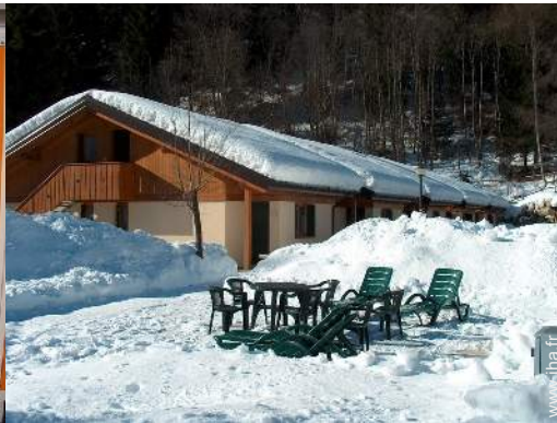
chaise(s) de jardin