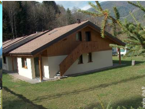
Chalet de Montagne