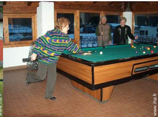
table de billard