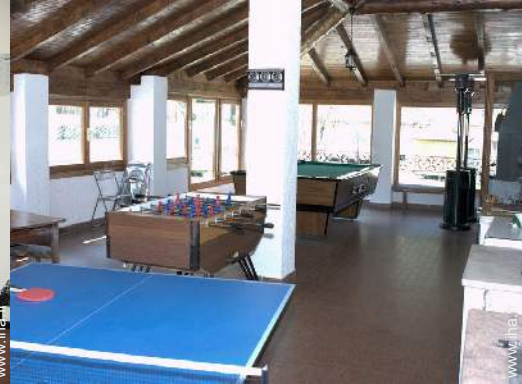
table de ping-pong