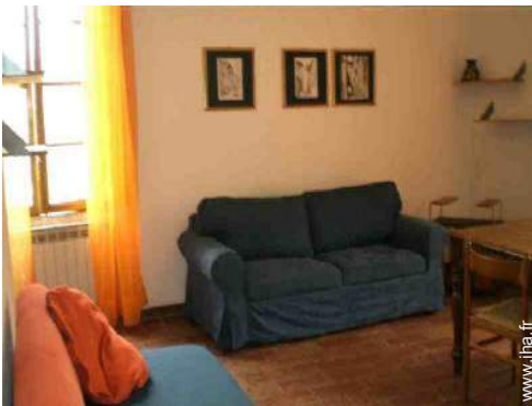
canapé-lit(s) 2 pers