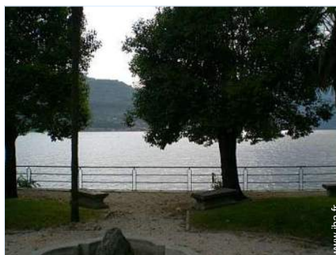
Equipements de loisir