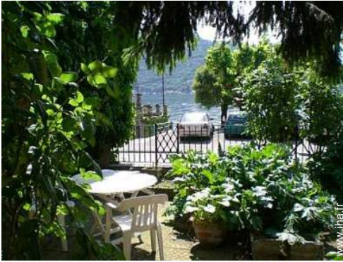
salon de jardin