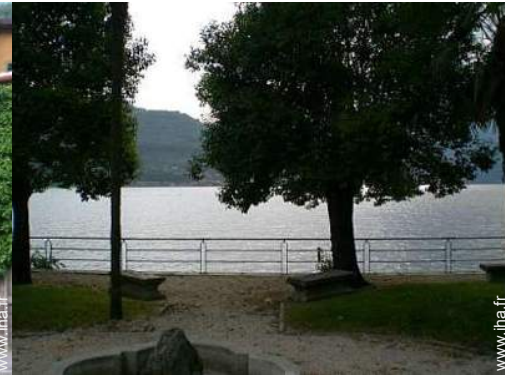
Equipements de loisir