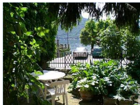
salon de jardin