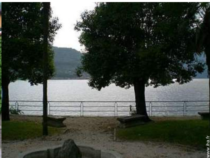
Equipements de loisir