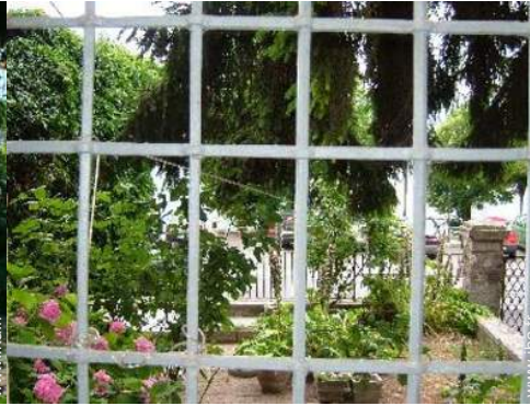
chaise(s) de jardin