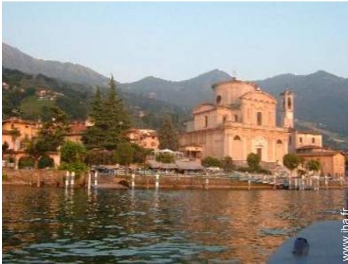
vue sur centre village