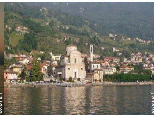
vue sur village