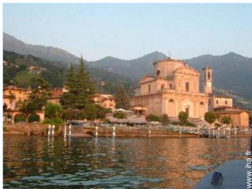
vue sur centre village