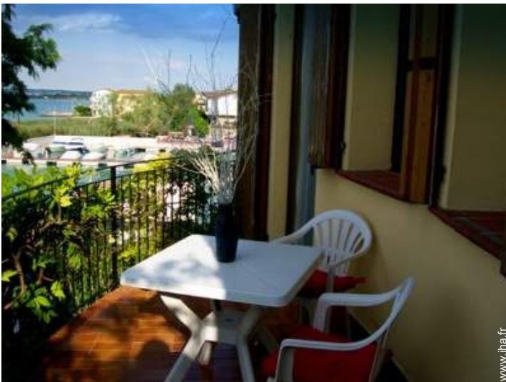
vue sur port