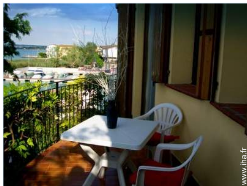
vue sur port