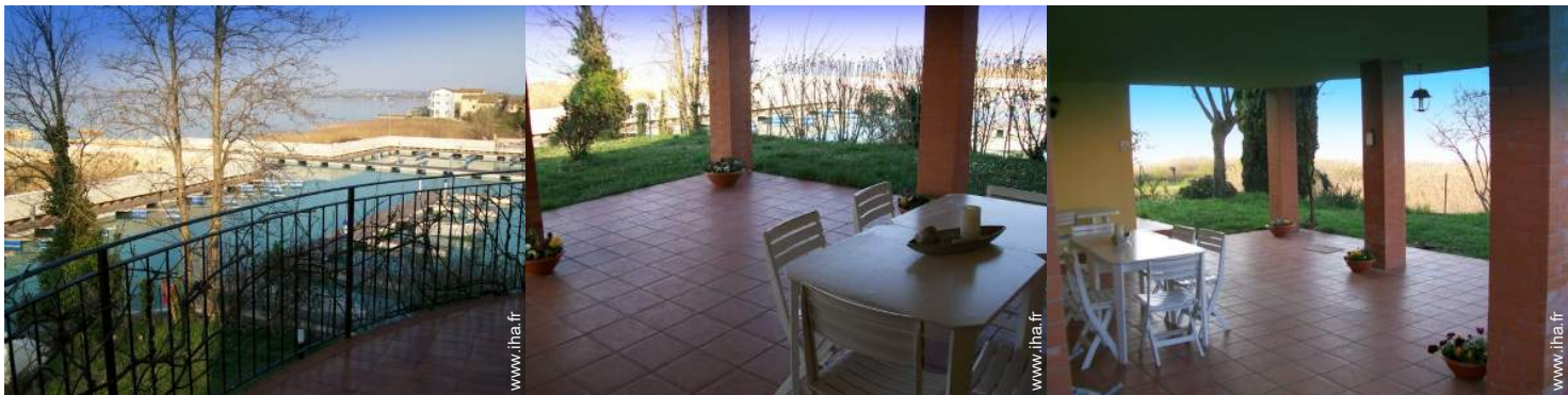
vue sur port