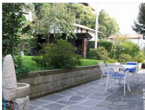
table(s) de jardin