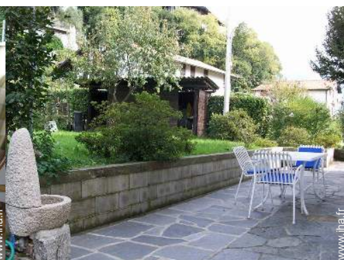
table(s) de jardin