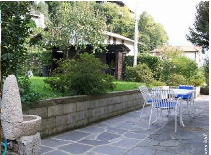
table(s) de jardin