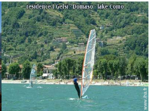
residence I Gelsi - Domaso - lake Como