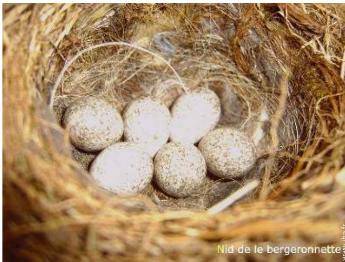
Nid de la bergeronnette