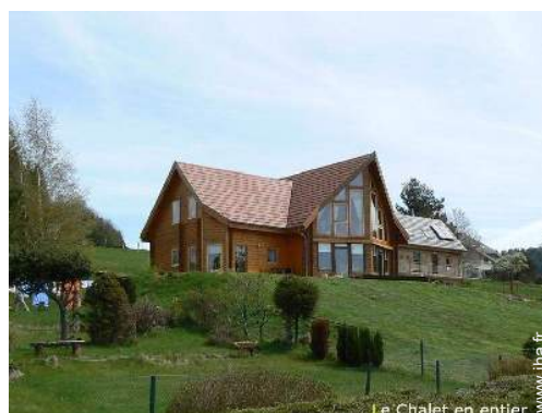
Le Chalet en entier