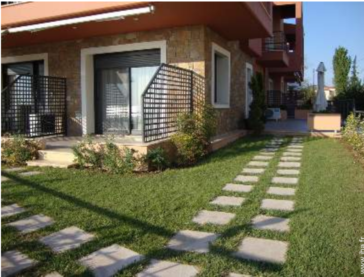
Studio de Charme