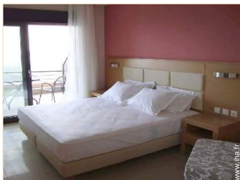
Couchage - lit(s)