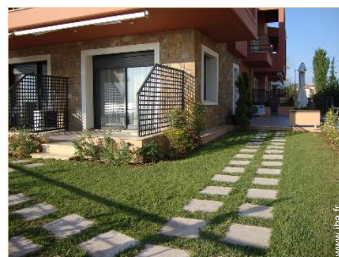
Studio de Charme