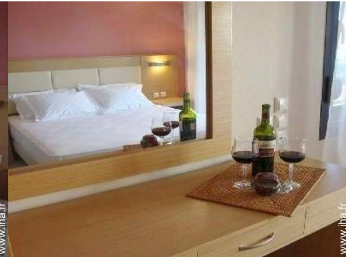
Couchage - lit(s)