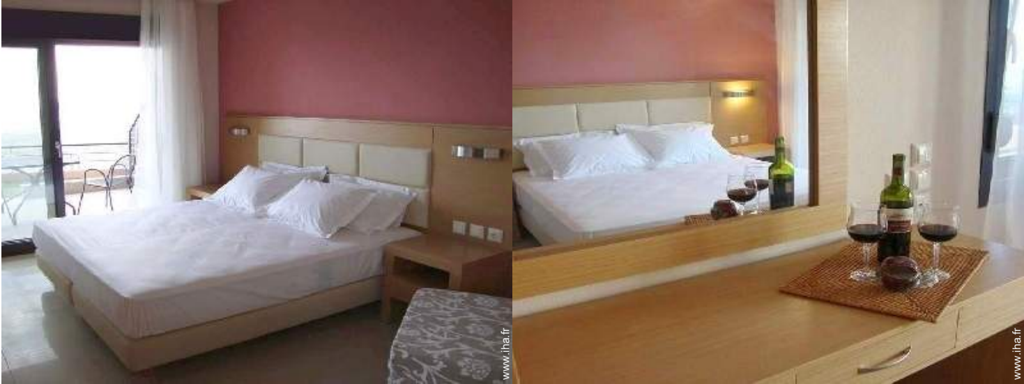
Couchage - lit(s)