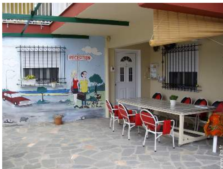
chambre du propriétaire