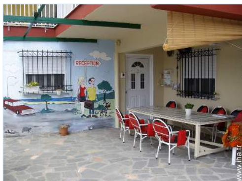
chambre du propriétaire