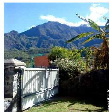
vue sur montagne