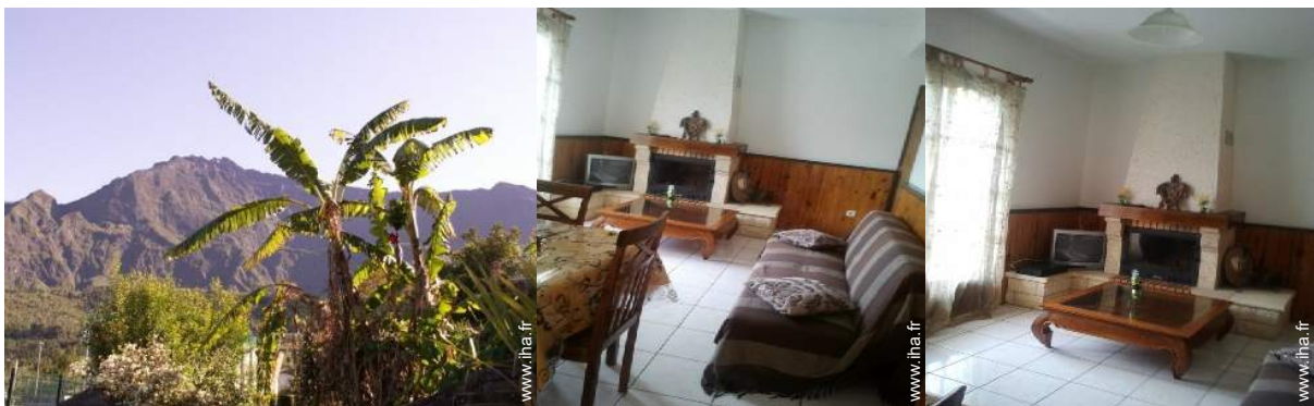
vue sur montagne