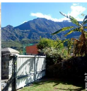
vue sur montagne