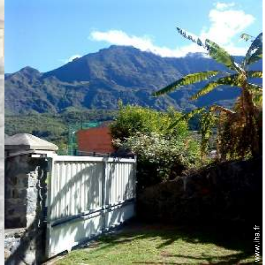
vue sur montagne