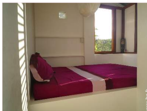
La chambre d'hôte