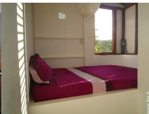
La chambre d'hôte