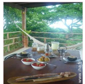
La chambre d'hôte