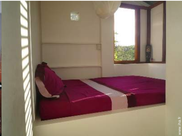
La chambre d'hôte