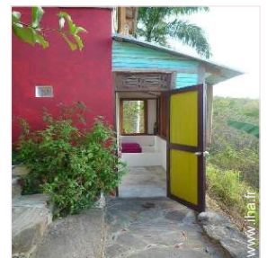
vue depuis la terrasse couverte