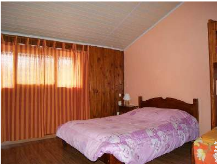
La chambre d'hôte