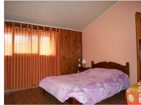
La chambre d'hôte