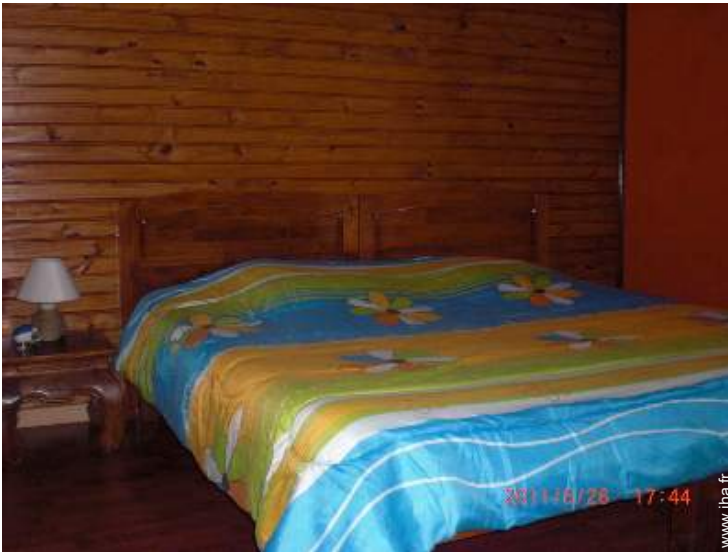
La chambre d'hôte