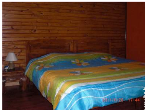
La chambre d'hôte