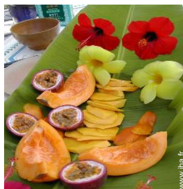
Présence sur place