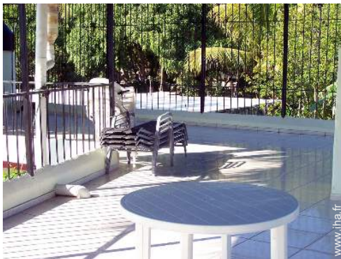
vue depuis la terrasse sur toit