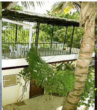
vue depuis la terrasse sur toit