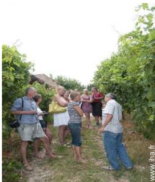
cave et dégustation de vin