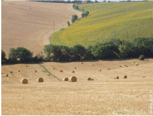
vue sur champs agricoles