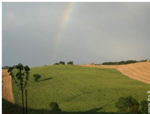
vue sur champs agricoles