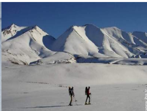
ski de fond