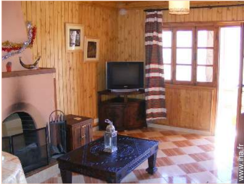
Chalet de Montagne de Prestige