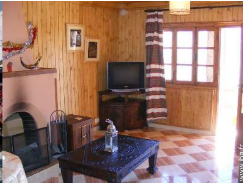
Chalet de Montagne de Prestige