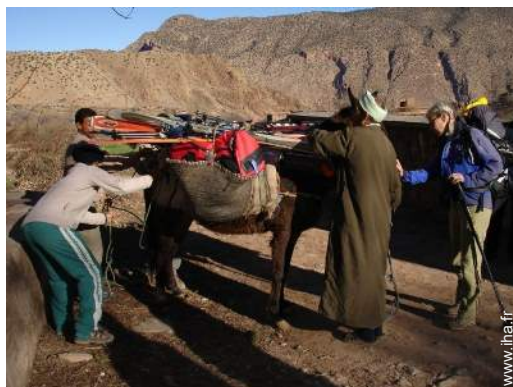
ski de randonnée