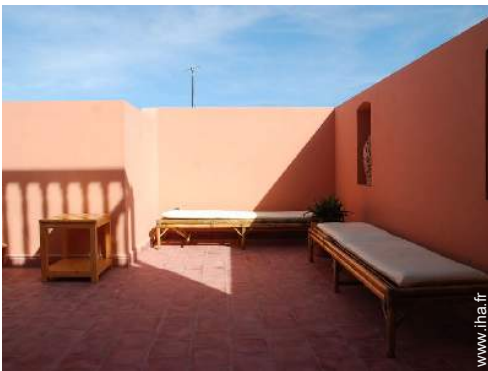
terrasse sur toit