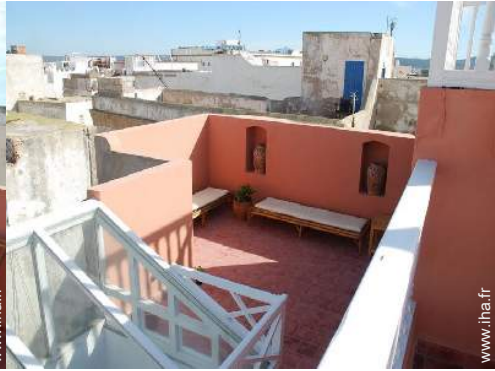
vue depuis la terrasse sur toit