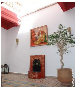
vue depuis la salle à manger