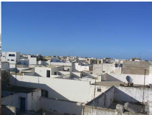
vue sur les toits