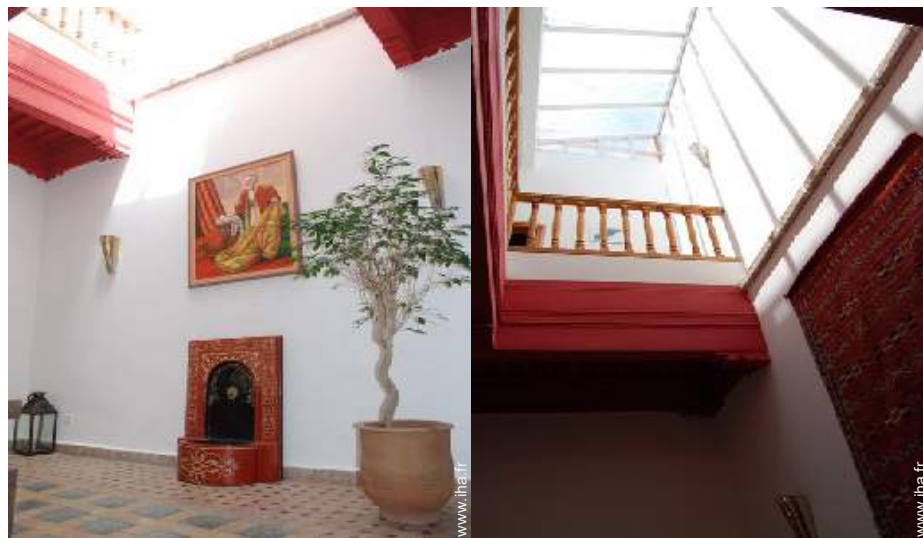
vue depuis la salle à manger