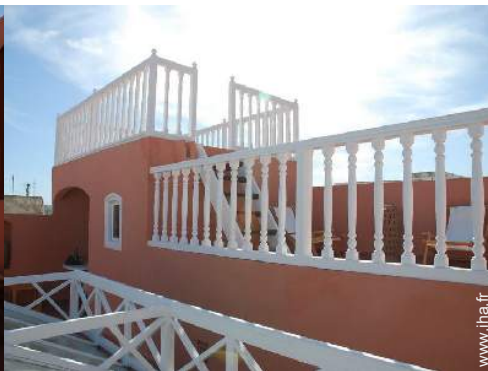
vue depuis la terrasse sur toit