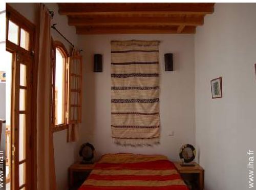
chambre du propriétaire