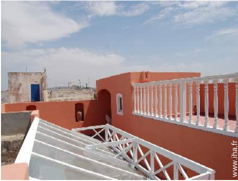
vue depuis la terrasse sur toit