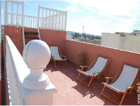
vue depuis la terrasse sur toit