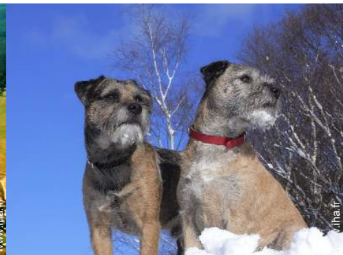
Les animaux de la maison