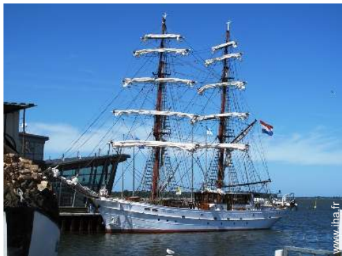
Attraits et détente