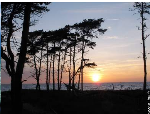
vue sur lac