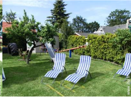
chaise(s) de jardin