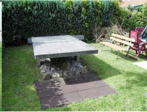
table de ping-pong