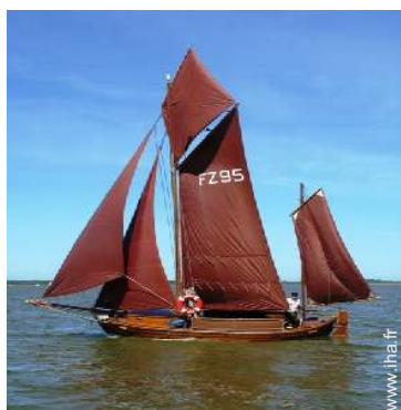
Attraits et détente