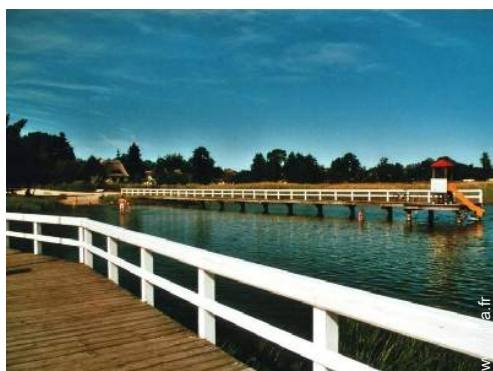
loisirs balnéaires à proximité