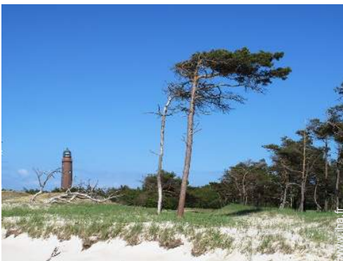
plage de naturisme