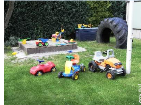
bac à sable