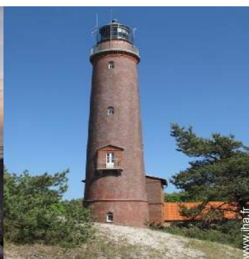
Attraits et détente