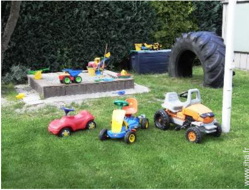
bac à sable