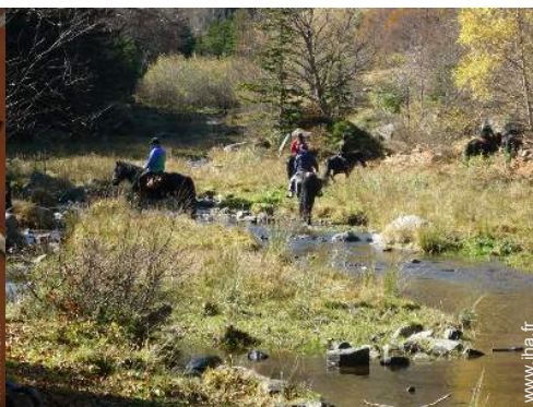
balade à cheval