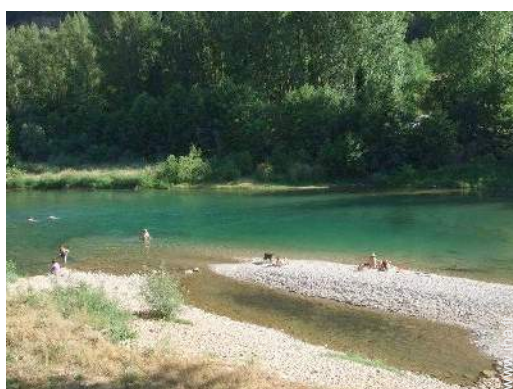
vue sur rivière