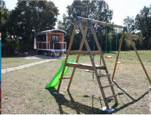
Cadre extérieur à disposition des hôtes