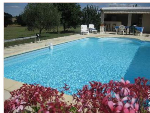
Equipements extérieurs à disposition des hôtes