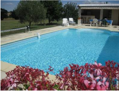
Equipements extérieurs à disposition des hôtes