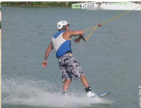
aménagement de loisirs