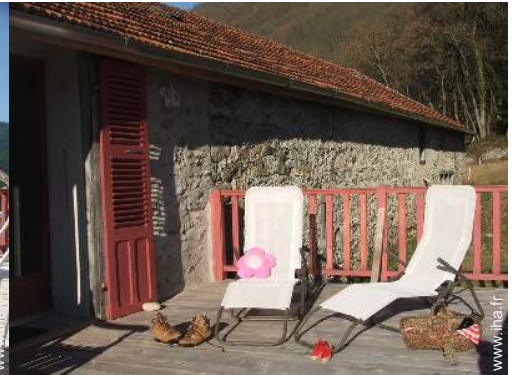
Maison de Charme en Pierre