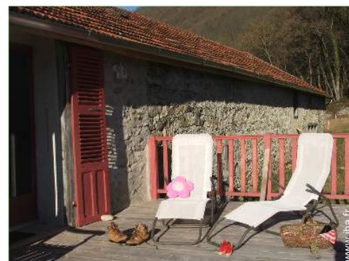
Maison de Charme en Pierre