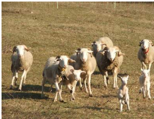
Les animaux de la maison