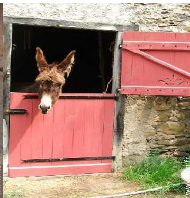
Les animaux de la maison