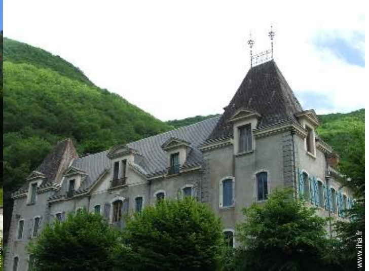
Propriété de Charme