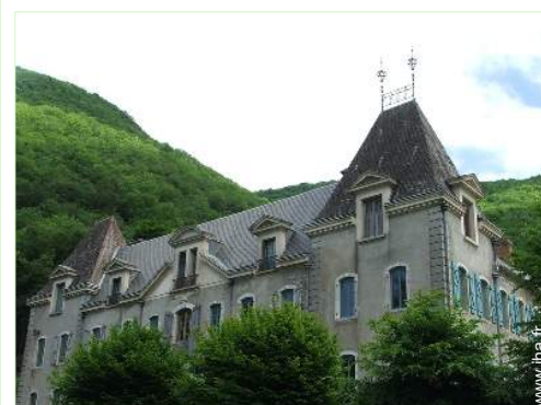
Propriété de Charme