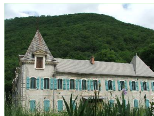
Propriété de Charme