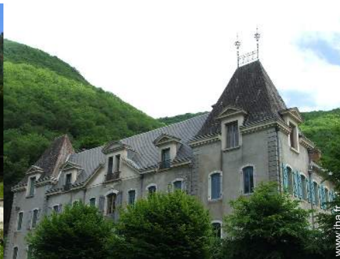
Propriété de Charme