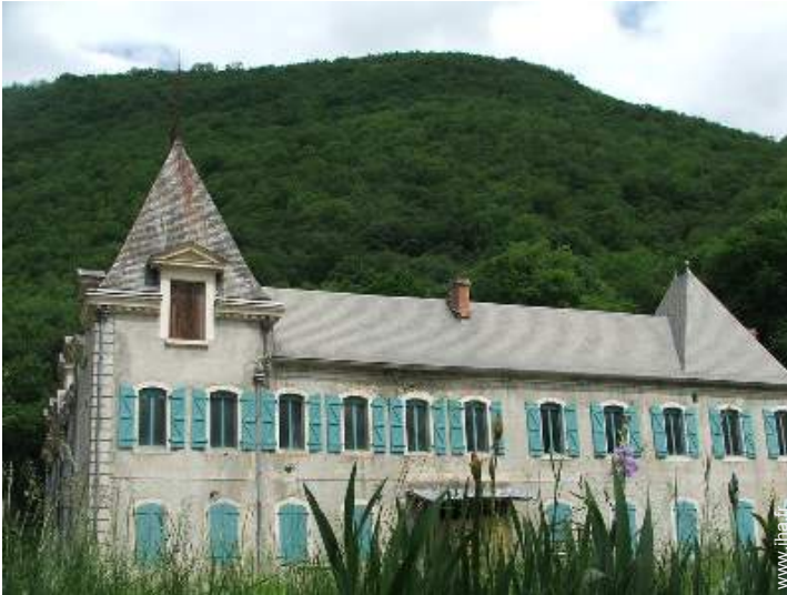
Propriété de Charme