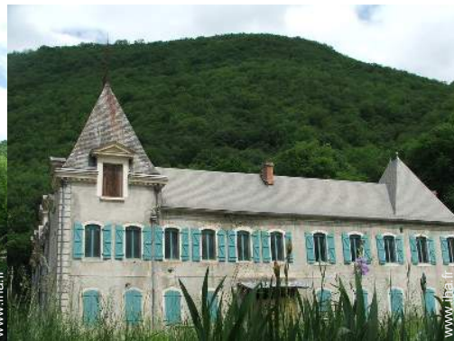
Propriété de Charme