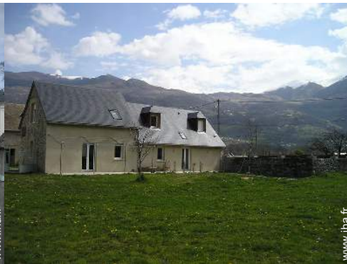
vue sur prairie