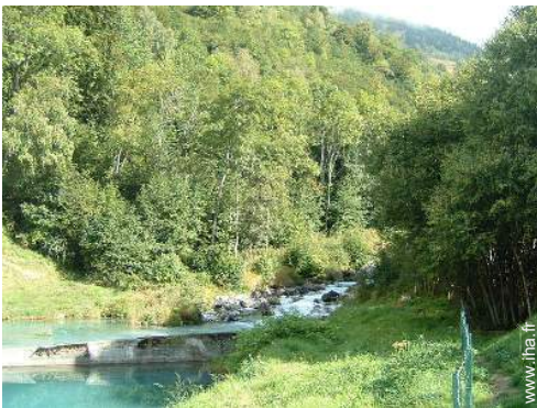
vue sur rivière