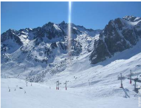
pistes de ski