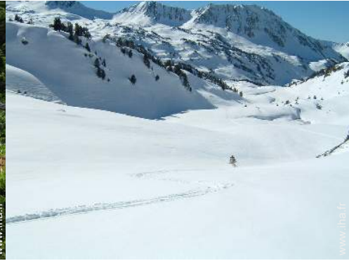
ski hors piste