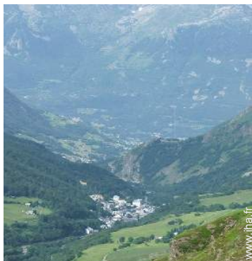
vue sur montagne