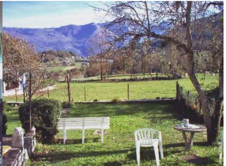
vue sur lac