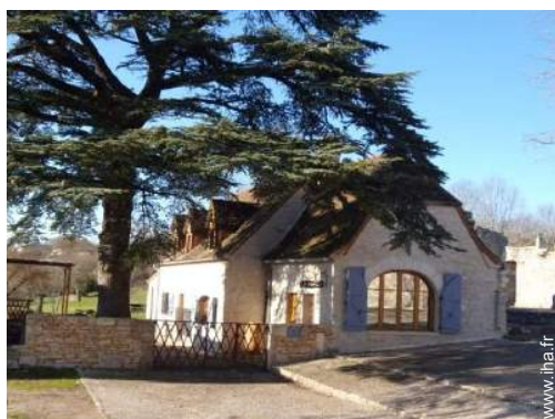
Maison de Campagne