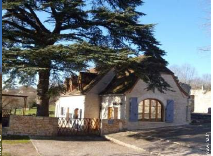
Maison de Campagne