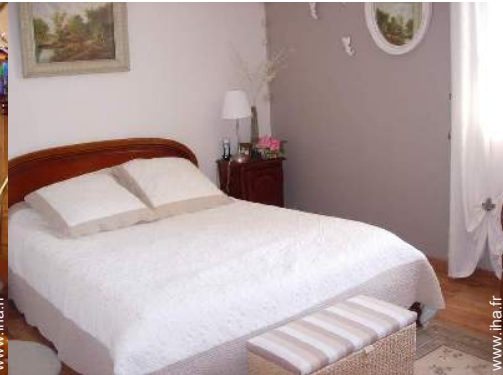
chambre du propriétaire