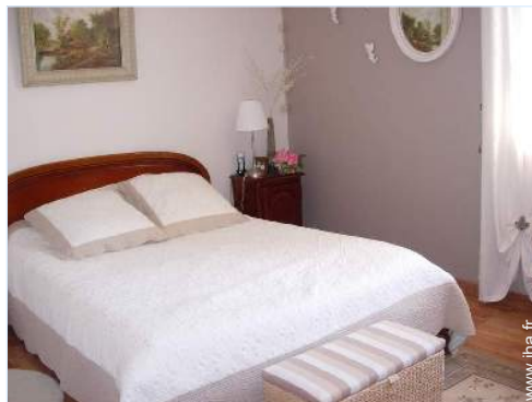
chambre du propriétaire