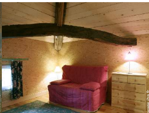
lit(s) escamotable(s) 2 pers