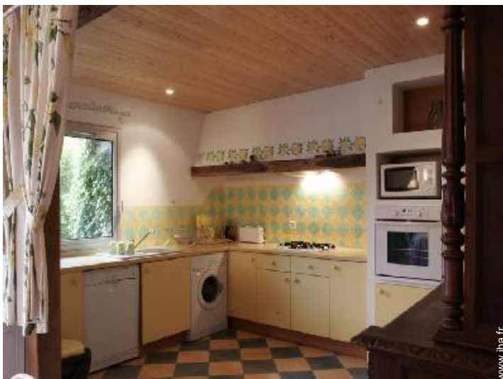
grande cuisine américaine