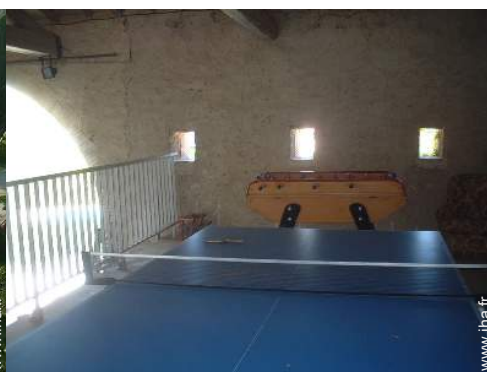
table de ping-pong