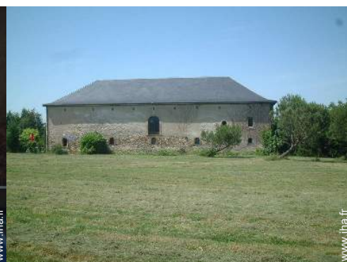
vue sur prairie