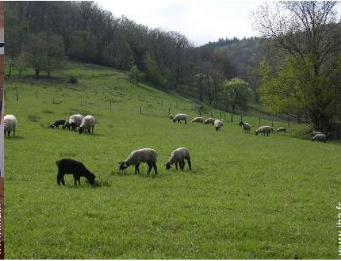
animaux de ferme