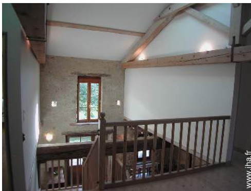
vue depuis la mezzanine