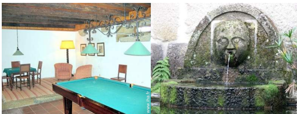
salle de jeux