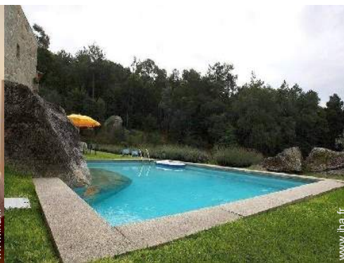
vue sur forêt