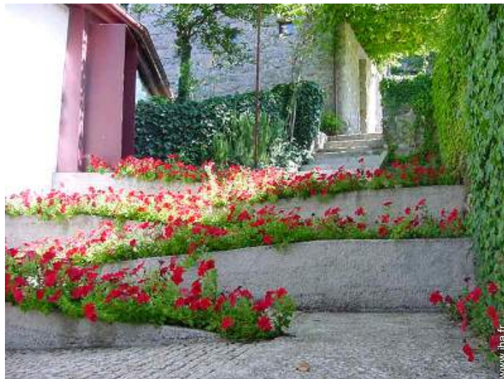
Propriété de Charme