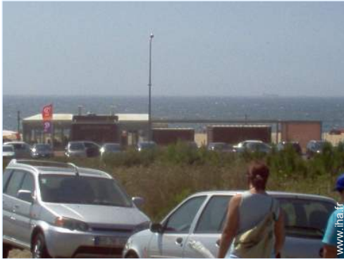
vue sur rue/avenue