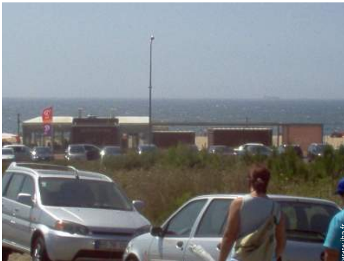
vue sur rue/avenue