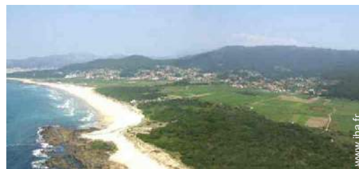
vue sur village