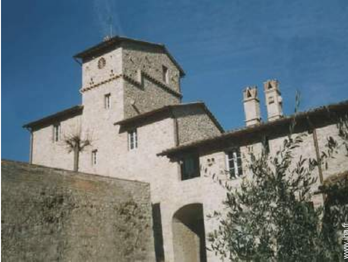
Mas de Charme