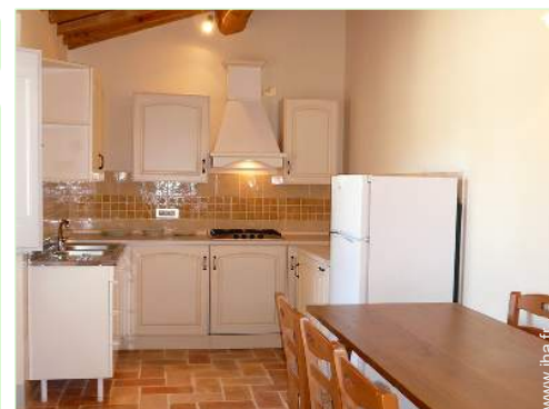
cuisinière à gaz

Barbecue, table(s) de jardin, chaise(s) de jardin, parasol, transat(s), balancelle, balançoire, douche extérieure, WC extérieur