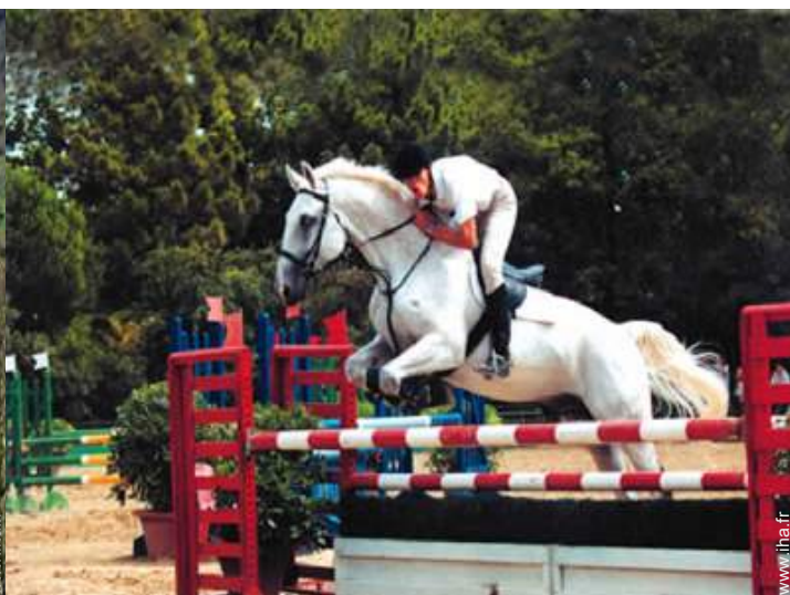
balade à cheval