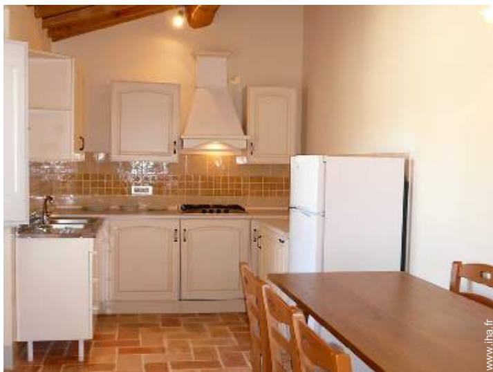
cuisinière à gaz