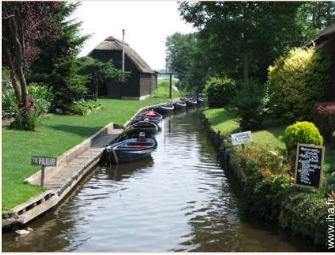
vue sur centre village