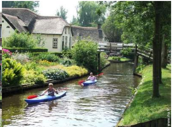
vue sur centre village