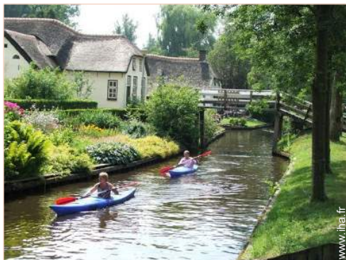
vue sur centre village