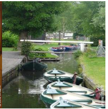
location de bateau