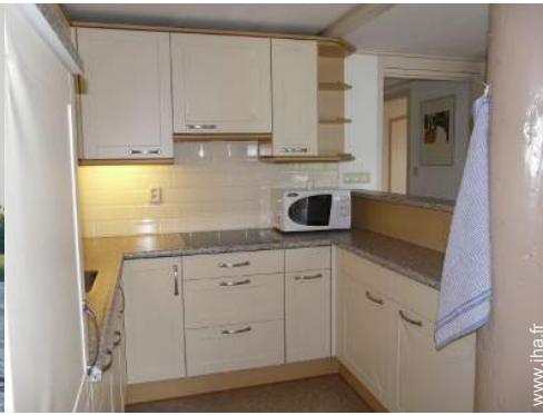
grande cuisine américaine