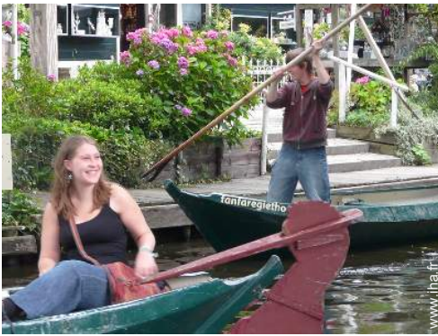
loisirs nautiques à proximité