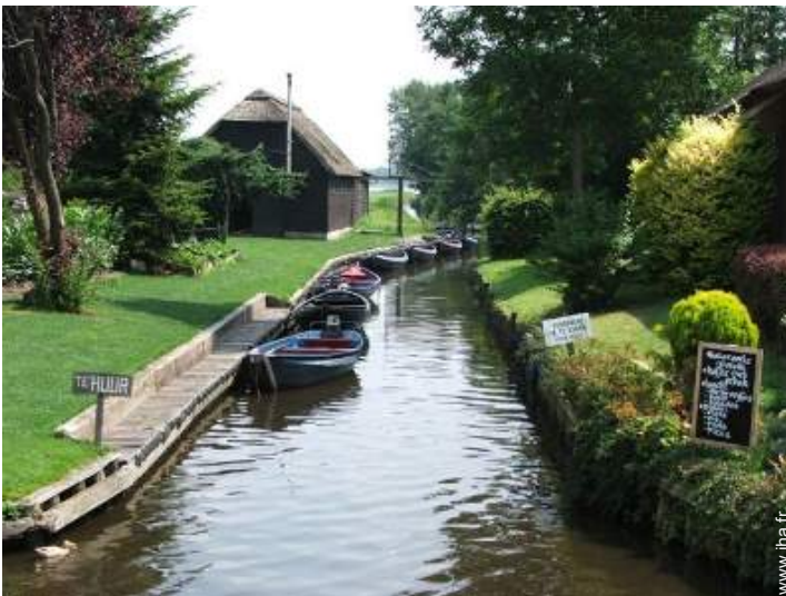
vue sur centre village