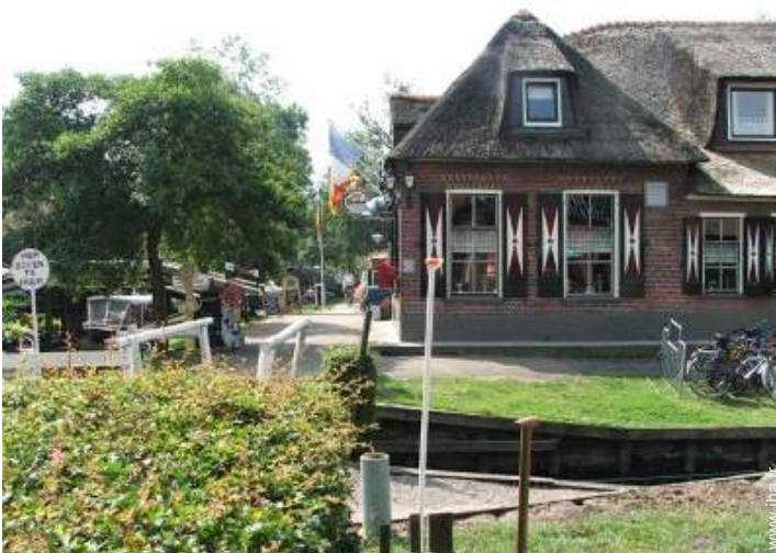
vue sur centre village