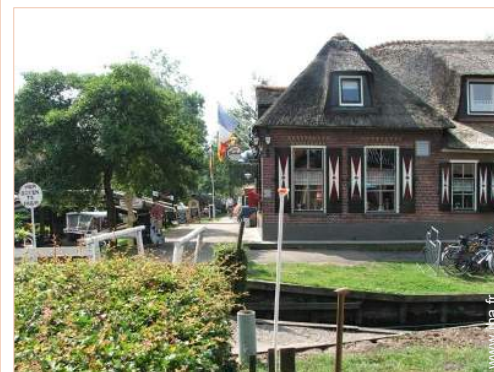
vue sur centre village