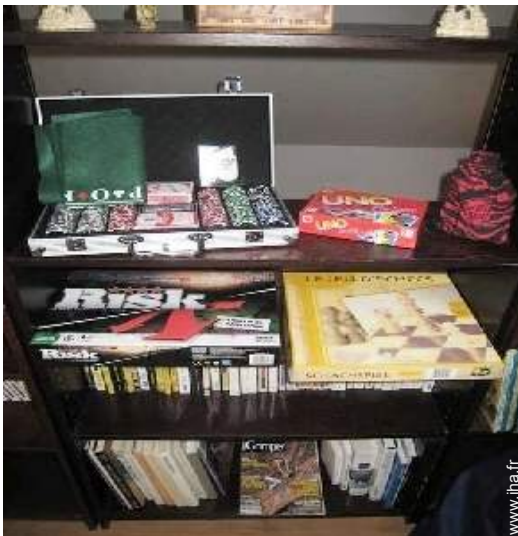
jeux de société